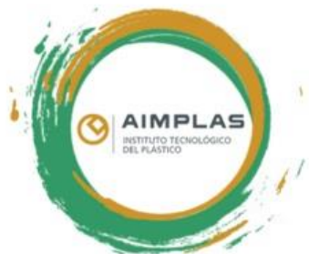
Tehnološki institut za plastiku